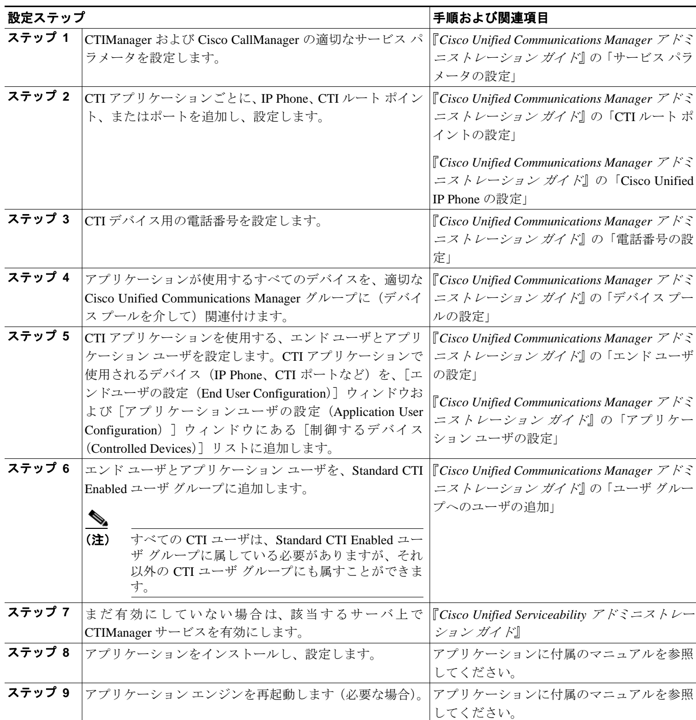
表 39-1 CTI 設定チェックリスト

(注) CTI アプリケーションをセキュリティ保護するには、『Cisco Unified Communications Manager セキュリティガイド』で CTI の認証と暗号化の設定に関する説明を参照してください。