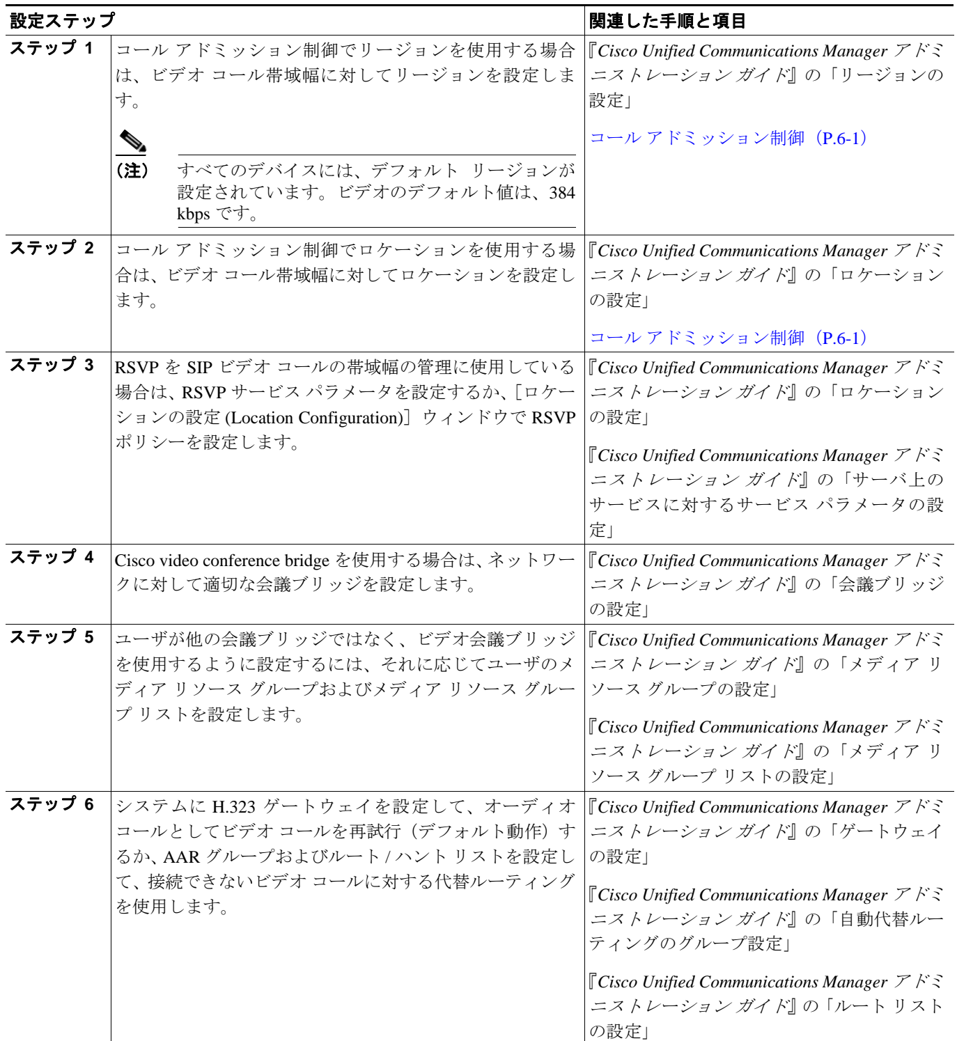
表 38-1 ビデオ テレフォニー設定チェックリスト

表 38-1 に、Cisco Unified Communications Manager の管理ページでビデオ テレフォニーを設定するためのチェックリストを示します。