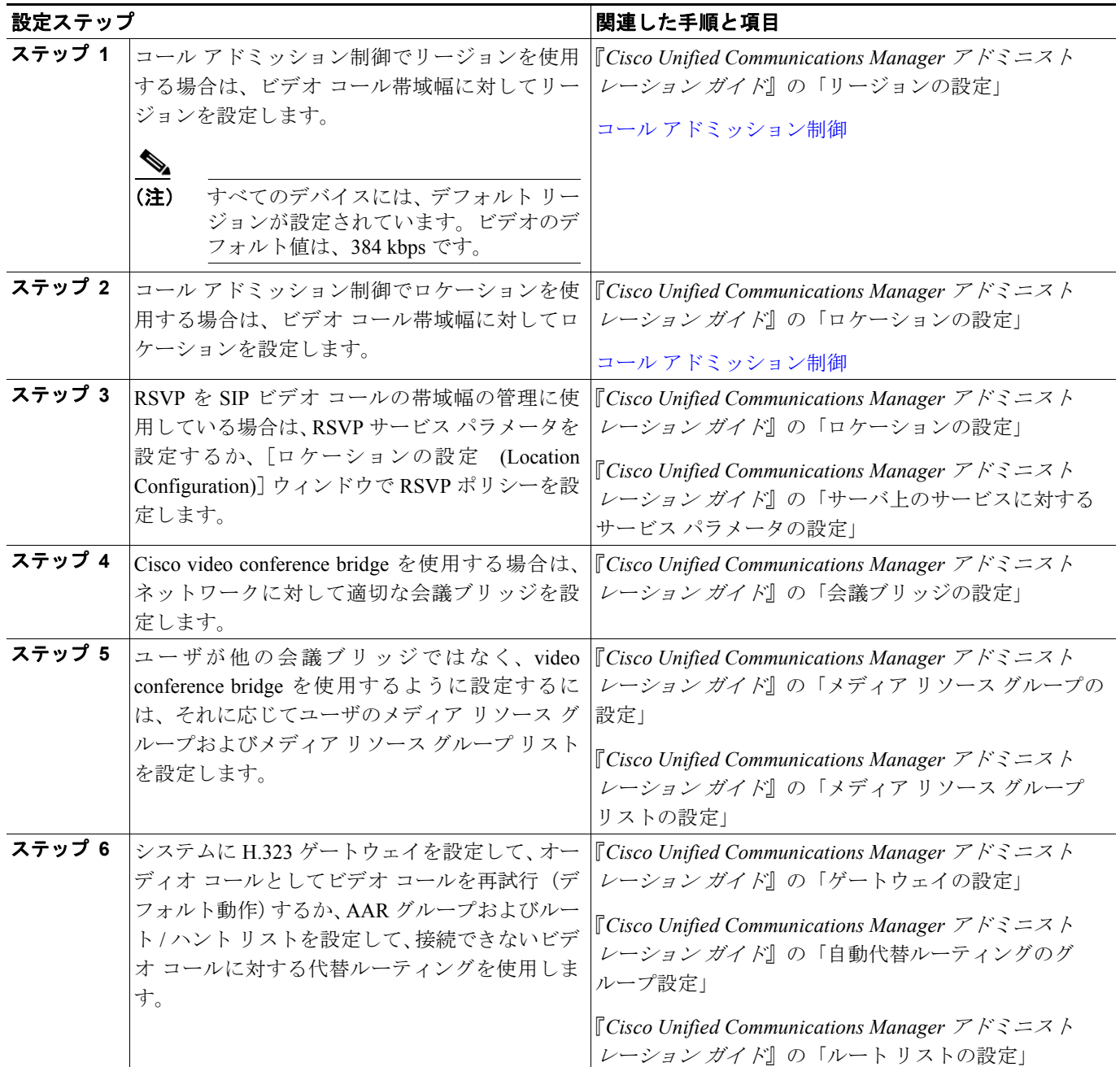
表 38-1 ビデオ テレフォニー設定チェックリスト

表 38-1 に、Cisco Unified Communications Manager の管理ページでビデオ テレフォニーを設定するためのチェックリストを示します。