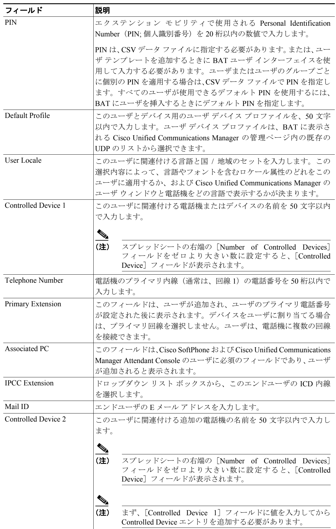
表 15-1 ユーザ追加用の BAT スプレッドシート内のフィールドの説明 (続き)