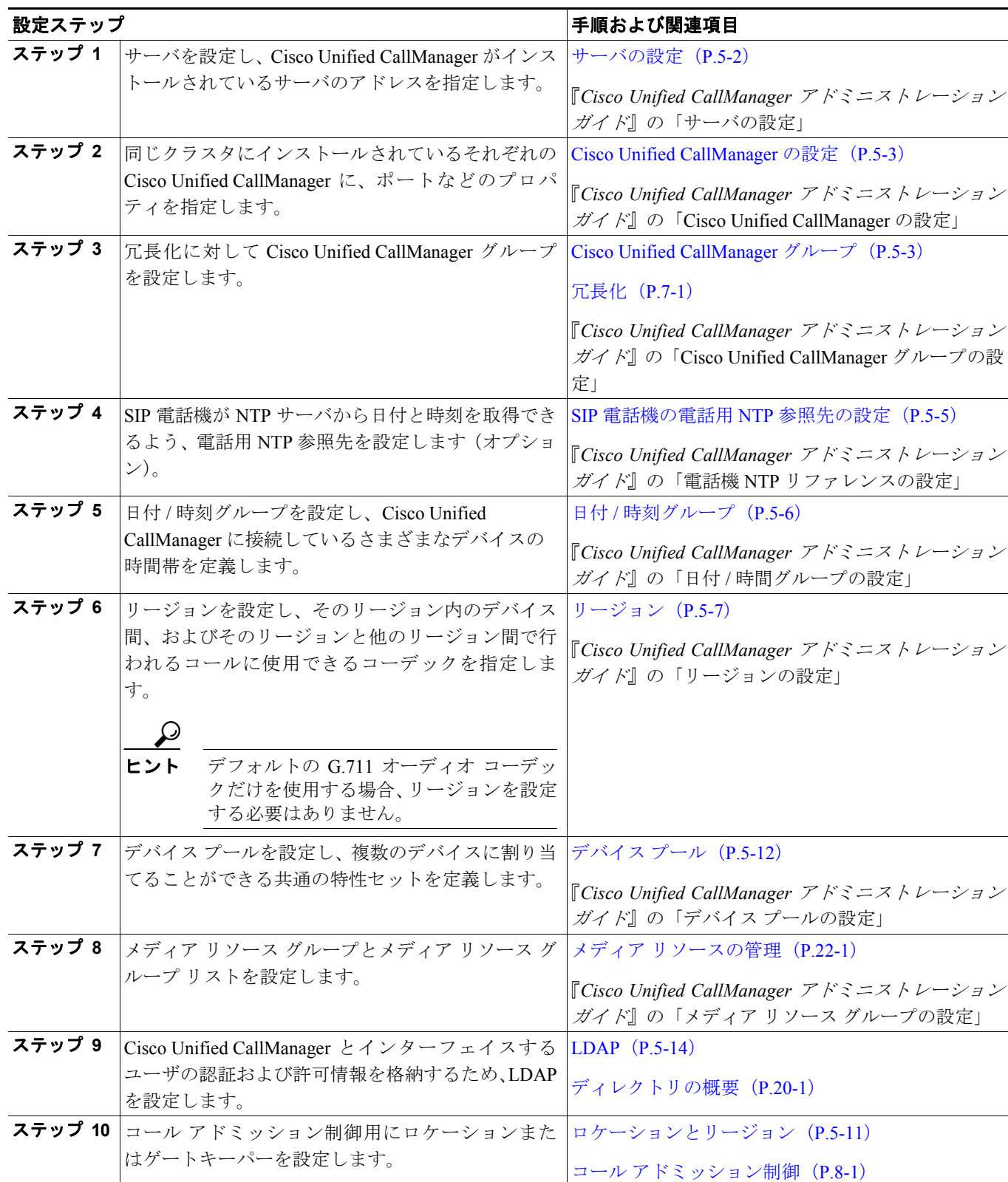
表 5-2 システム設定チェックリスト

表 5-2 は、システム レベルの設定値を設定するための一般的な手順を示しています。