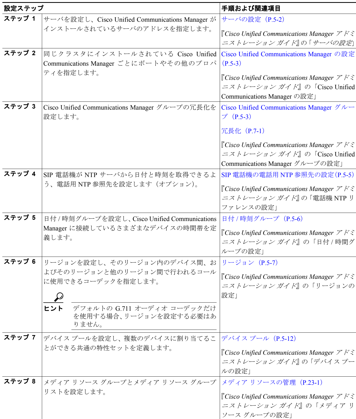
表 5-2 システム設定チェックリスト

表 5-2 は、システム レベルの設定値を設定するための一般的な手順を示しています。