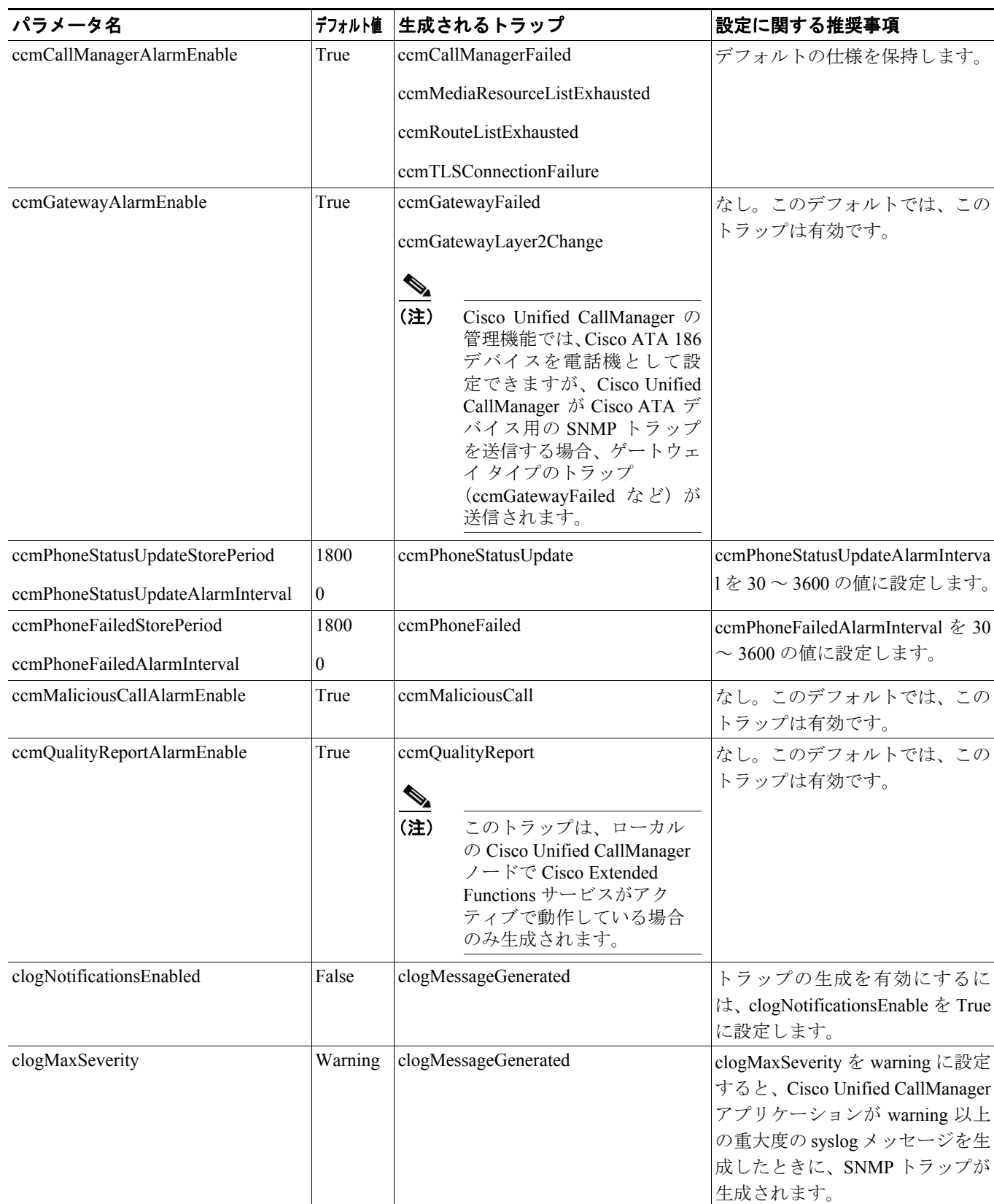
表 10-1 Cisco Unified CallManager のトラップとインフォームの設定パラメータ

表 10-1 は、Cisco Unified CallManager のトラップとインフォームのパラメータについて説明しています。