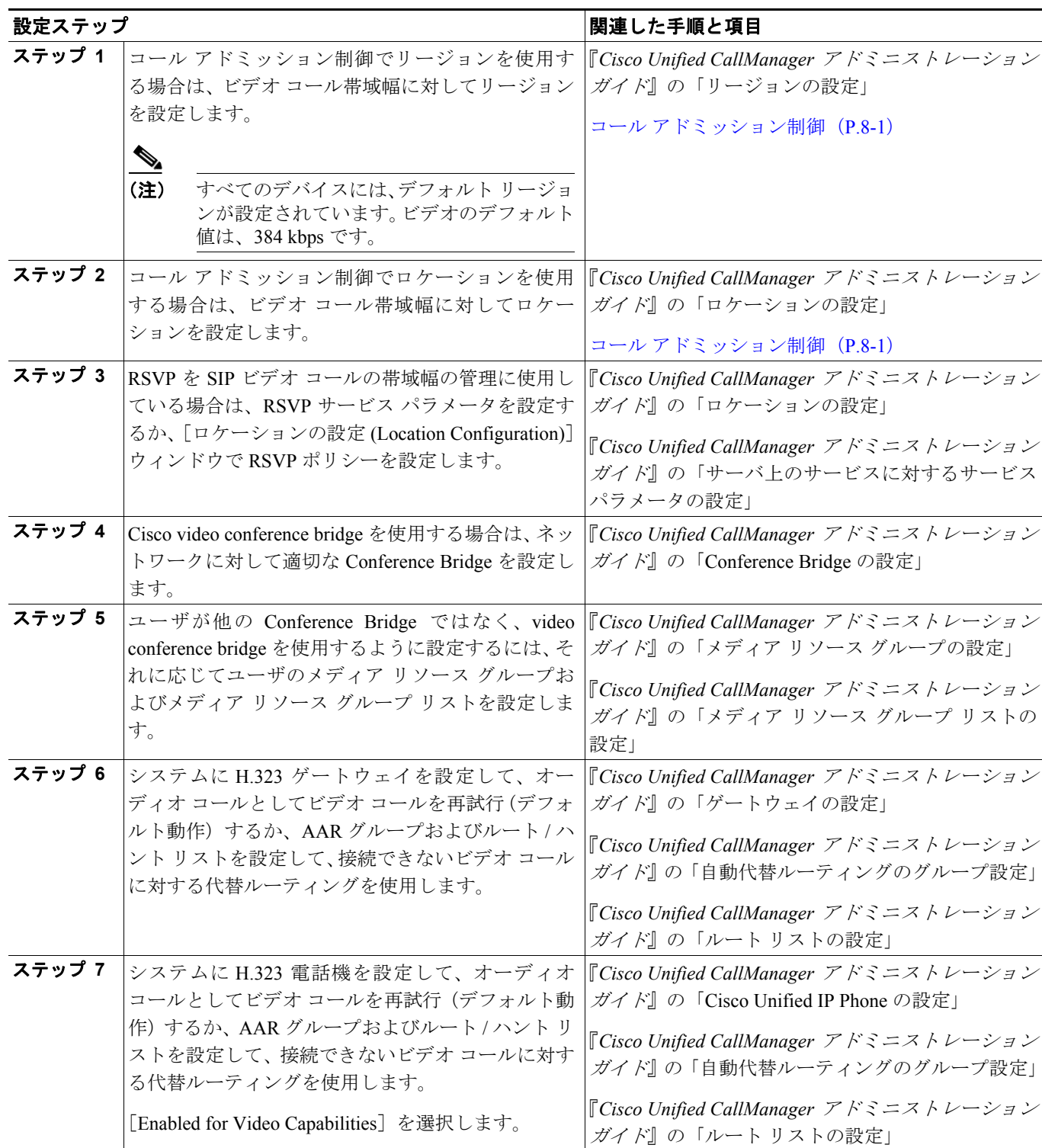
表 44-1 ビデオ テレフォニー設定チェックリスト

表 44-1 に、Cisco Unified CallManager の管理ページでビデオ テレフォニーを設定するためのチェックリストを示します。