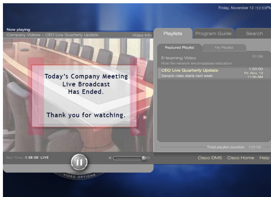
図 5-4 終了後にイベントを表示した場合

ライブイベントは、予定終了日時の 1 時間後に Video Portal から自動的に削除されます。ライブイベントが自動的に期限切れになると、そのイベントは再生リスト、プログラムガイド、および検索結果から完全に削除されます。