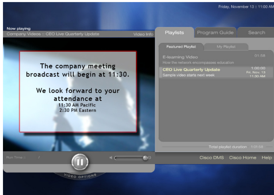
図 5-2 予定時間前にライブコンテンツを表示した場合

参加者は、公開されたブロードキャスト開始日より少し早く Video Portal にログインします。ここで目的のビデオを呼び出すと、このイベントがまだ開始されていないことを視聴者に通知する静止画像が表示されます (図 5-2 を参照)。この画像は、発行者にイベント前画像として知られています。発行者が Digital Media Manager でブロードキャストを開始するまで、そのビデオを表示しているクライアントには引き続きこの画像が表示されます。