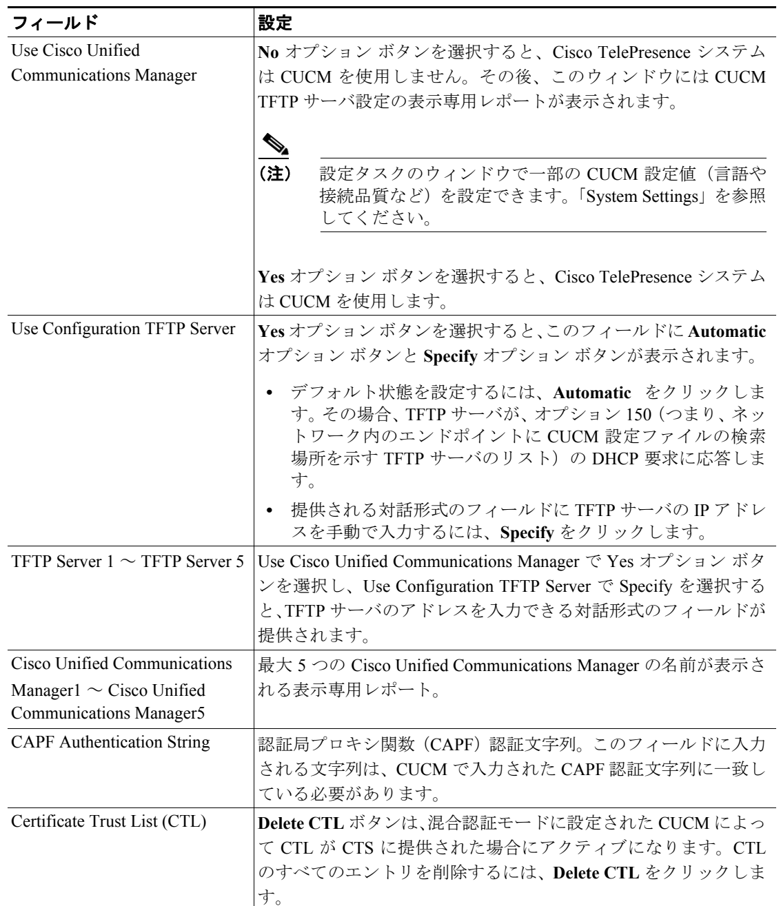
表 3-2 Cisco Unified Communications Manager 設定