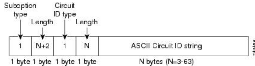
図 1: 回線 ID を指定した場合のサブオプションパケットフォーマット

次の図に、DHCP スヌーピングがグローバルに有効になっており、リモート ID サブオプションを指定して ip dhcp snooping information option グローバル コンフィギュレーション コマンドを入力した場合に使用されるパケットフォーマットを示します。