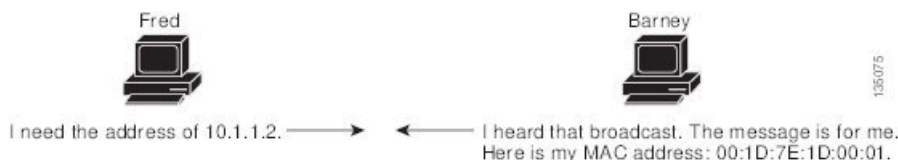
図 1: ARP 処理

宛先デバイスが、別のデバイスを挟んだりリモートネットワーク上にあるときは、同じ処理が行われますが、データを送信するデバイスが、デフォルトゲートウェイの MAC アドレスを求める ARP 要求を送信する点が異なります。アドレスが解決され、デフォルトゲートウェイがパケットを受信した後に、デフォルトゲートウェイは、接続されているネットワーク上で宛先の IP アドレスをブロードキャストします。宛先デバイスのネットワーク上のデバイスは、ARP を使用して宛先デバイスの MAC アドレスを取得し、パケットを配信します。ARP はデフォルトでイネーブルにされています。