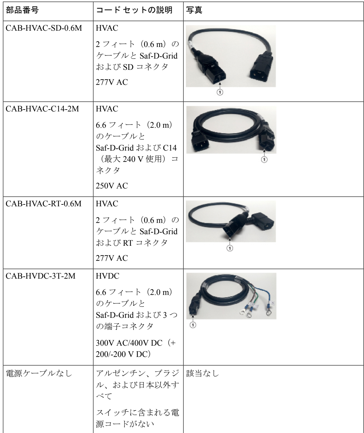
表 1: HVAC/HVDC 電源ケーブルのコールアウトテーブル