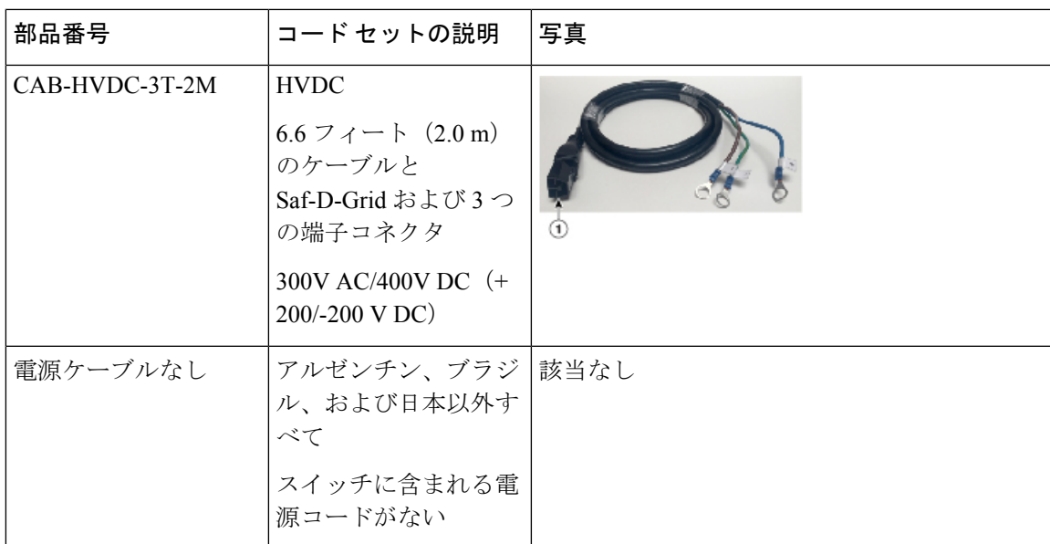
表 1: HVAC/HVDC 電源ケーブルのコールアウト テーブル