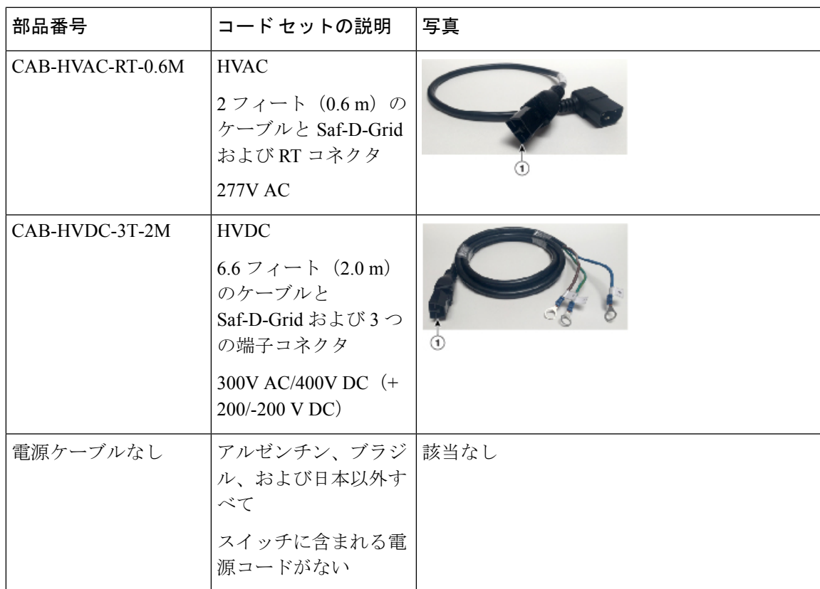
表 1: HVAC/HVDC 電源ケーブルのコールアウトテーブル