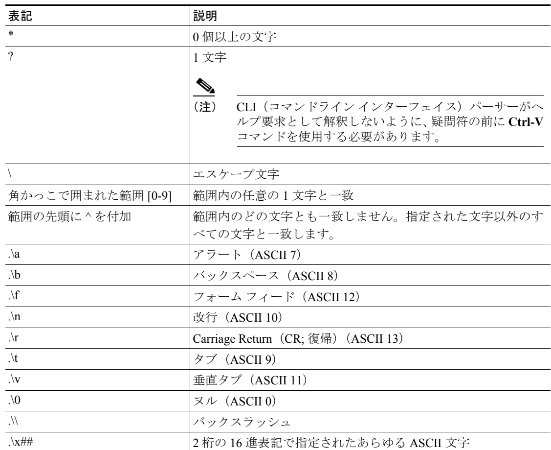
表 6-1 文字列と一致する特殊文字