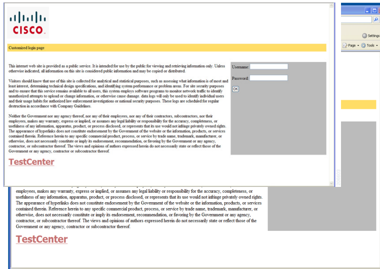
図 12-5 カスタマイズ可能な認証ページ

詳細については、「 認証プロキシ Web ページのカスタマイズ 」(P.12-14) を参照してください。