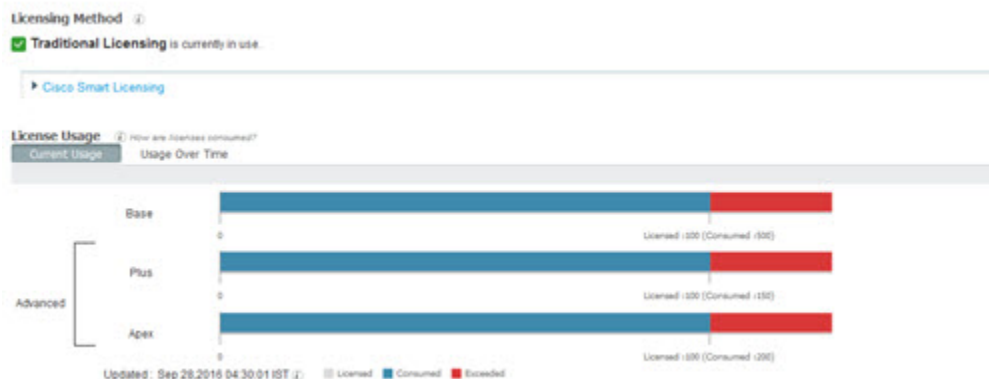
図 4: 従来のライセンスの使用

[ライセンスの使用状況 (License Usage)] エリアのライセンス消費グラフは、30分ごとに更新されます。このウィンドウには、購入したライセンスの種類、システムで許可される同時ユーザーの総数、およびサブスクリプションサービスの有効期限も表示されます。