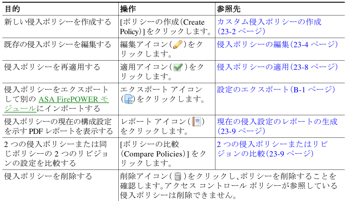
表 23-1 侵入ポリシー管理操作