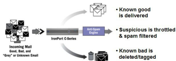
Figure 2: 送信者 IP レピュテーションフィルタリングの例

送信者レピュテーションフィルタリングがイネーブルになっている場合は、既知の悪質な送信者からのメールだけが拒否されます。世界中の 2000 社から送信された既知の良好なメールは自動的にスパムフィルタを避けてルーティングされるため、誤検出の可能性が低減されます。未知、または「灰色」の電子メールは、アンチスパム スキャンエンジンにルーティングされます。送信者 IP レピュテーションフィルタは、この方法を使用して、コンテンツフィルタにかかる負荷を最大 50% 低減できます。