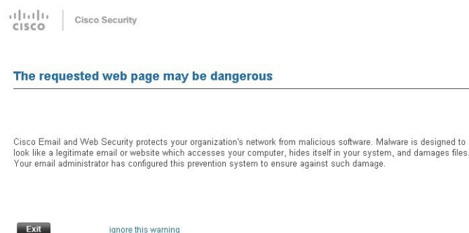
Figure 1: シスコのセキュリティによるスプラッシュ画面の警告 ( proxy_splash_screen )

Cisco Web セキュリティ プロキシにアクセスする唯一の方法は、メッセージ内の URL を書き換えることです。Web ブラウザで URL を入力しても、プロキシにはアクセスできません。