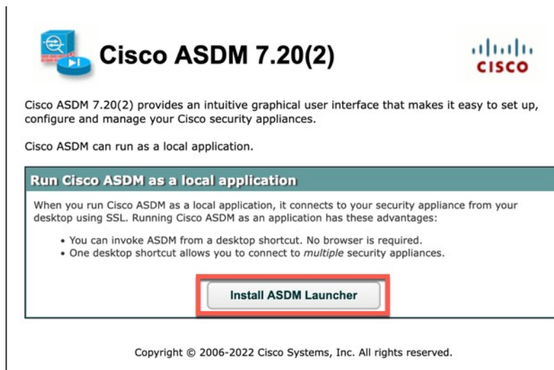
図 1: ASDM Launcher のインストール