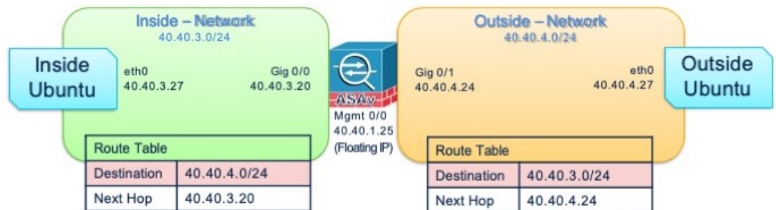
図 2: OpenStack への ASA の導入例

次の図は、ASA の 3 つのサブネット（管理、内部、外部）が OpenStack 内に設定されているルーテッドファイアウォールモードの ASA の推奨ネットワークトポロジを示しています。