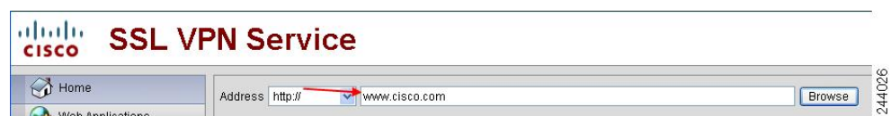
図 1: ユーザが入力した URL の例

デフォルトでは、ASA はすべての Web リソース (HTTPS、CIFS、RDP、プラグインなど) に対するすべてのポータルトラフィックを許可します。クライアントレス SSL VPN は、ASA だけに意味のあるものに各 URL をリライトします。ユーザは、要求した Web サイトに接続されていることを確認するために、この URL を使用できません。フィッシング Web サイトからの危険にユーザがさらされるのを防ぐには、クライアントレスアクセスに設定しているポリシー (グループ ポリシー、ダイナミック アクセス ポリシー、またはその両方) に Web ACL を割り当ててポータルからのトラフィック フローを制御します。これらのポリシーの URL エントリをオフに切り替えて、何にアクセスできるかについてユーザが混乱しないようにすることをお勧めします。