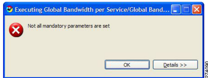
図 B-2 エラー メッセージ

エラーの詳細を表示するには、[Details] をクリックします (図 B-3)。