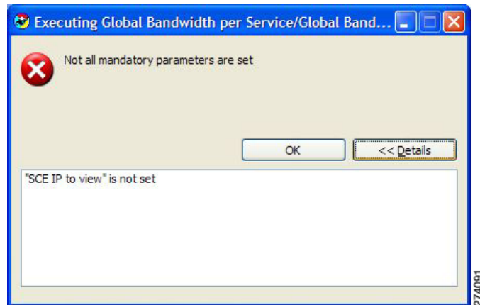
図 B-3 エラー メッセージの詳細

エラーの詳細を表示するには、[Details] をクリックします (図 B-3)。