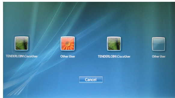
図 C-3 オーバーレイなしの AnyConnect アイコン