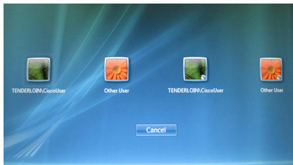
図 C-4 オーバーレイを使用した Anyconnect アイコン

図 C-4 に、ネットワーク アクセス マネージャ CP とサードパーティ CP の両方をインストールしたシステムからのログイン画面を示します。この例では、AnyConnect アイコンはログオン タイル上に表示され、ネットワーク アクセス マネージャ CP を示しています。