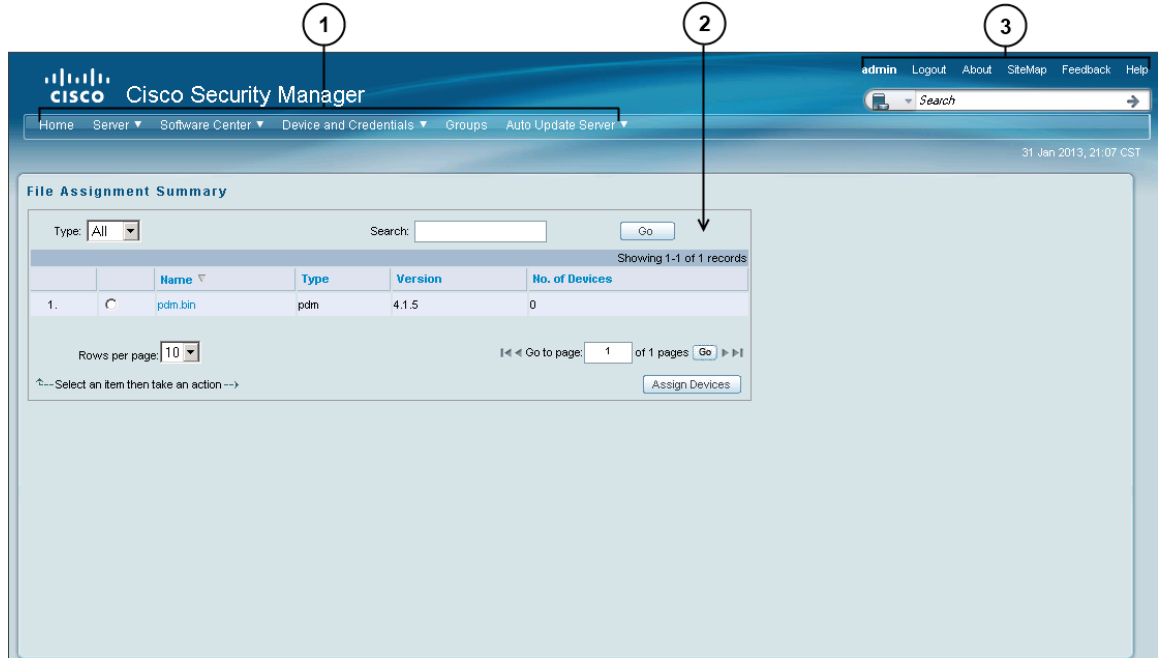
図 1-1 AUS GUI