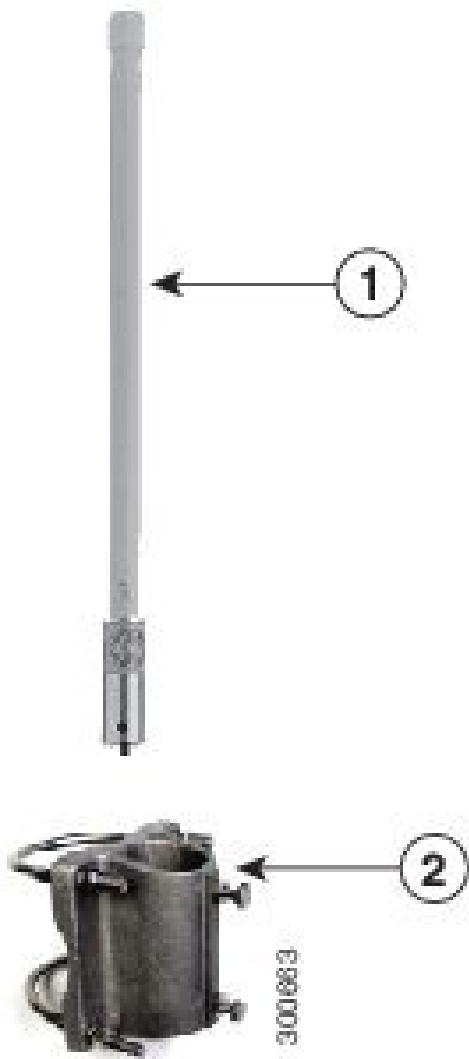
図 3: アンテナおよびブラケット

マストにアンテナを取り付けるには、次の手順に従います。取り付け方法については、次の図を参照してください。