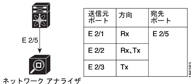
図 5-1 SPAN の設定

図 5-1 に、SPAN の設定を示します。3 つのイーサネット ポート上のパケットが宛先ポートのイーサネット 2/5 にコピーされます。コピーされるのは、指定した方向のトラフィックだけです。