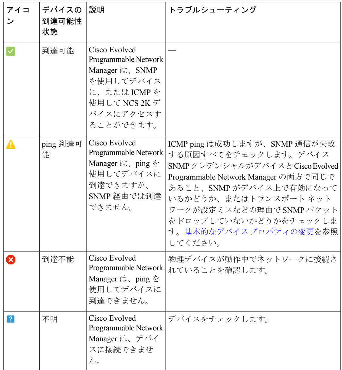
表 4: デバイスの到達可能性状態

デバイスの管理状態 ：デバイスの設定状態を表します（たとえば、デバイスが ping によって到達できないためにダウンしている場合や、管理者が手動でデバイスをシャットダウンした場合などです）。