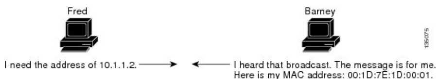
図 1: ARP 処理

宛先デバイスが、別のデバイスを挟んだりリモートネットワーク上にあるときは、同じ処理が行われますが、データを送信するデバイスが、デフォルトゲートウェイの MAC アドレスを求める ARP 要求を送信する点が異なります。アドレスが解決され、デフォルトゲートウェイがパケットを受信した後に、デフォルトゲートウェイは、接続されているネットワーク上で宛先の IP アドレスをブロードキャストします。宛先デバイスのネットワーク上のデバイスは、ARP を使用して宛先デバイスの MAC アドレスを取得し、パケットを配信します。ARP はデフォルトでイネーブルにされています。