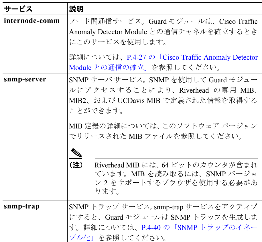
表 4-1 Guard モジュール サービス