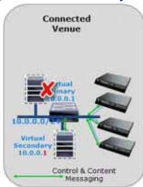
図 4 Cisco Vision Dynamic Signage Director 手動フェールオーバーにおける冗長性

元のプライマリ サーバと同じ IP アドレスを使用するようにセカンダリ サーバを再構成する必要があることに注意してください。この例では、セカンダリ サーバの IP アドレスをプライマリ サーバのアドレスに合わせて 10.0.0.2 から 10.0.0.1 に変更しています。プロセスが完了すると、通信と制御は、新しく有効になったセカンダリ サーバとネットワークの他の部分との間でのみ行われるようになります。