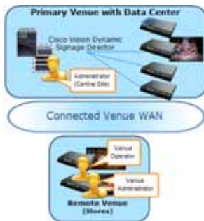
図 6 集中型の階層管理 Cisco Vision Dynamic Signage Director

プライマリ管理者は施設関連のすべての機能を実行できます。たとえば、施設管理者、施設オペレータ、コンテンツ、およびスクリプトを、対応する施設固有の制御スコープに割り当てることができます。リモートの施設では、リモートの施設オペレータが、自分に割り当てられた施設の制御スコープに関連付けられているスクリプトを制御できます。