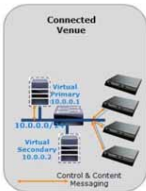
図 3 Cisco Vision Dynamic Signage Director 通常の動作における冗長性

図 4 (13 ページ) は、プライマリ Cisco Vision Dynamic Signage Director サーバからの接続が障害を起こしたときの冗長環境を示しています。プライマリ サーバが障害を起こした場合は、手動のプロセスを通じて、バックアップからセカンダリ サーバを復元し、プライマリ サーバをシャットダウンし、セカンダリ サーバを有効にする必要があります。