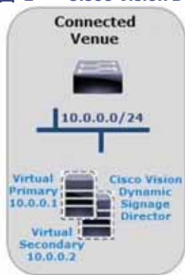
図 2 Cisco Vision Dynamic Signage Director 冗長性

Cisco Vision Dynamic Signage Director は、2 台のサーバーまたはデュアル仮想サーバーの環境をサポートしています。図 2 (12 ページ) は、1 つのサブネットにインストールされた Cisco Vision Dynamic Signage Director を実行している 2 つの仮想サーバを示しています。