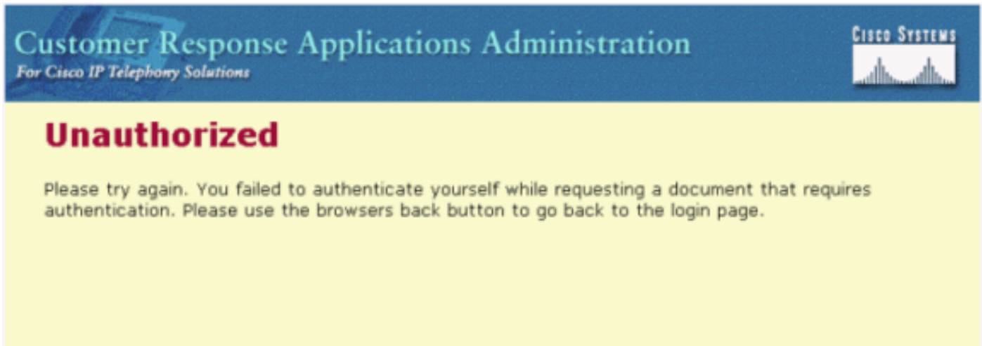
図 1： 認証する失敗

Cisco IPCC Express サーバが再製された後、管理者属性のエージェントは認証しません。Cisco Unified Contact Center Express にサーバを記録する試みが試みられるとき、エージェントはこの エラーメッセージ を受け取ります。