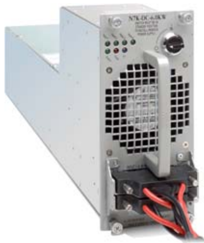
図 1 Cisco Nexus 7000 シリーズの DC 電源

Cisco Nexus 7000 シリーズの各システムは複数電源に対応しており、システムおよび データセンター設備の両方で電源の耐障害性を実現します。Cisco Nexus 7000 シリーズでは、企業やサービス プロバイダーといったお客様の多様なニーズにお応えするため、さまざまな AC 電源装置および DC 電源装置オプションを提供しています。