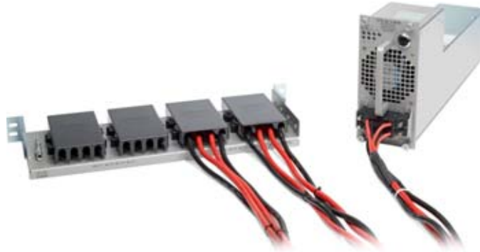
図 3 Cisco Nexus 7000 シリーズ DC Power Interface Unit