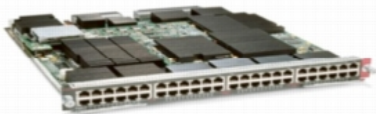
図 1 分散型シスコ エクスプレス フォワーディング ドーター カード ( 製品番号 WS-F6700-DFC3 ) を搭載したシスコ エクスプレス フォワーディング 720 10/100/1000 インターフェイス モジュール ( 製品番号 WS-X6748-GE-TX )

1 キューの凡例：1p3q1t = プライオリティ キュー X 1、ラウンド ロビン キュー X 3、しきい値 X 1