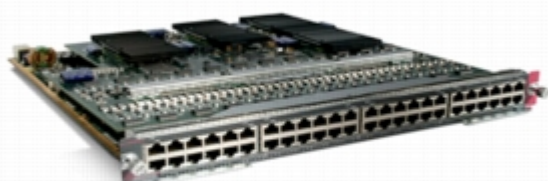
図 7 Cisco クラシック 96 ポート 10/100