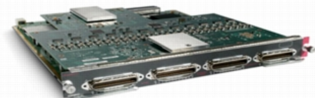
図 9 Cisco クラシック 48 ポート 10/100 802.3af PoE モジュール、RJ-21 ( 製品番号 WS-X6148-21AF )

図 8 Cisco クラシック 48 ポート 10/100 802.3af PoE モジュール ( 製品番号 WS-X6148A-45AF )