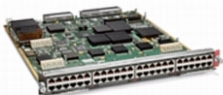
図 3 シスコ エクスプレス フォワーディング 256 銅線 10/100 インターフェイス モジュール ( 製品番号 WS-X6548-RJ-45 )