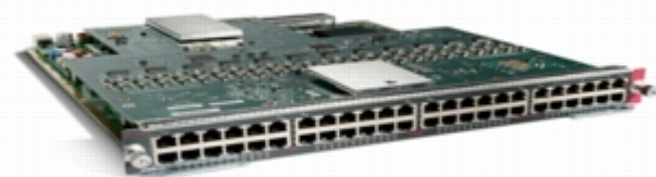
図 8 Cisco クラシック 48 ポート 10/100 802.3af PoE モジュール ( 製品番号 WS-X6148A-45AF )

802.3af PoE モジュール ( 製品番号 WS-X6148X2-45AF )