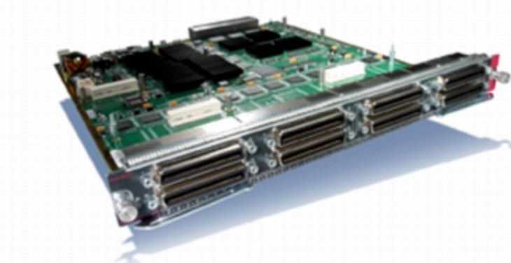
図 10 Cisco クラシック 96 ポート 10/100 ( 802.3af PoE モジュールへのフィールド アップグレード オプション付き ) ( 製品番号 WS-X6196-RJ-21 )

図 9 Cisco クラシック 48 ポート 10/100 802.3af PoE モジュール、RJ-21 ( 製品番号 WS-X6148-21AF )