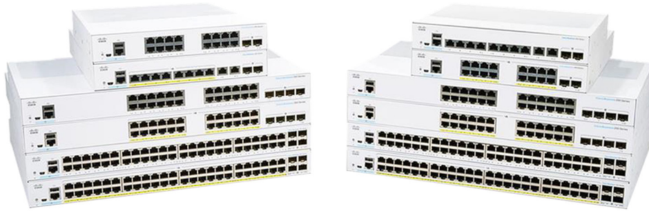
図 2. Cisco Business 350 シリーズ マネージドスイッチ