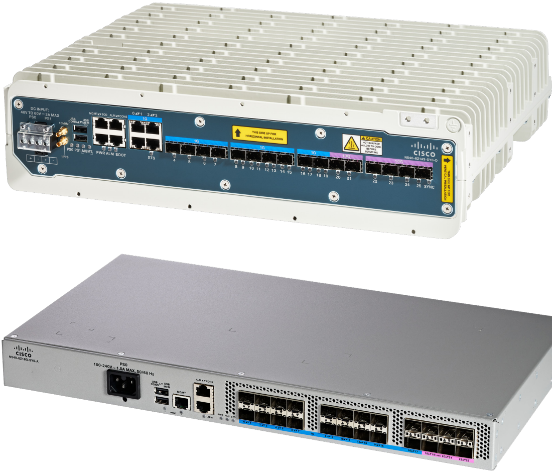
図 1. Cisco NCS 540 低密度ルータ