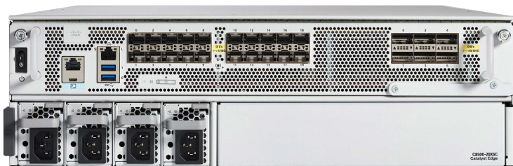
図 1. C8500-20X6C

C8500L-8S4X プラットフォーム (図 4) は 1/10GE ポートを 4 個、1GE ポートを 8 個搭載しています。