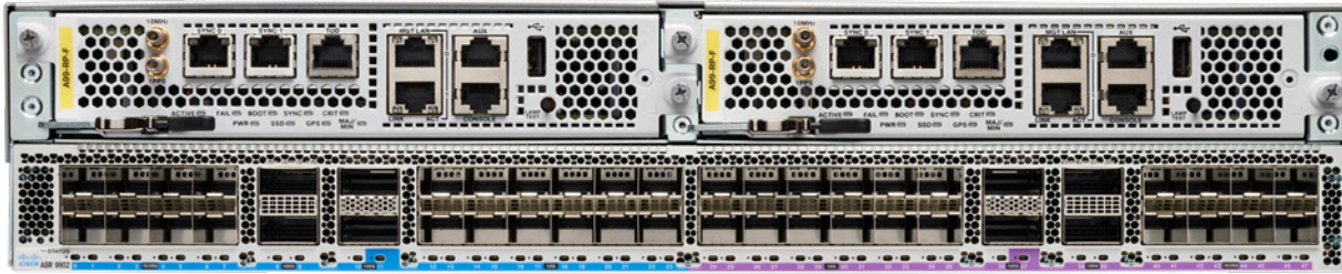
図 1. Cisco ASR 9902 シャーシ