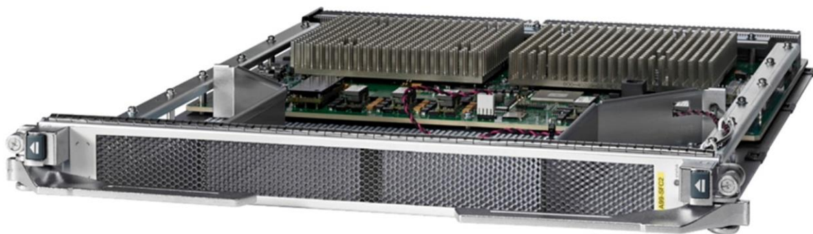
図 1. Cisco ASR スイッチファブリックカード 2

Cisco® ASR 9900 スイッチファブリックカード 2 (図1)、スイッチファブリックカード S (図 2)、スイッチファブリックカード T (図 3) は、Cisco ASR 9922 ルータ、ASR 9912 ルータ、ASR 9910 ルータ、および ASR 9906 ルータ向けの次世代スイッチファブリックであり、高密度 100 ギガビット イーサネット ラインカードをサポートします。Cisco ASR 9900 スイッチファブリックカード 2 (ASR 9900 SFC2)、スイッチファブリックカード S (ASR 9900 SFC-S)、およびスイッチファブリックカード T (ASR 9900 SFC-T) のシステムアーキテクチャは、昨今の有線、データセンター相互接続 (DCI)、および無線アクセスネットワーク (RAN) の集約型アプリケーションで必要とされる最新のプログラム可能な導入モデル、ならびにレイヤ 2 とレイヤ 3 サービスの統合に対応できるように設定されています。