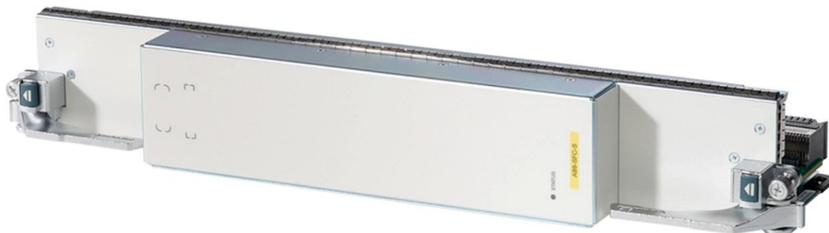
図 2. Cisco ASR スイッチファブリックカード S