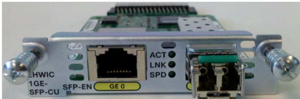
図 1 Cisco ギガビット イーサネット EHWIC-1GE-SFP-CU