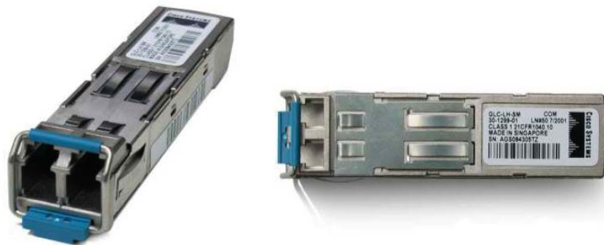
図 1 ギガビット イーサネット SFP

業界標準であるシスコの Small Form-Factor Pluggable (SFP) GBIC (ギガビット インターフェイス コンバータ) は、ギガビット イーサネット ポートやスロットに接続して使用し、ホットスワップ可能な入出力デバイスとしてポートのネットワーク接続を可能にします (図 1)。SFP は各種シスコ製品でサポートされており、ポートに応じて 1000BASE-SX、1000BASyE-LX/LH、1000BASE-ZX、または 1000BASE-BX10-D/U と組み合わせて使用できます。