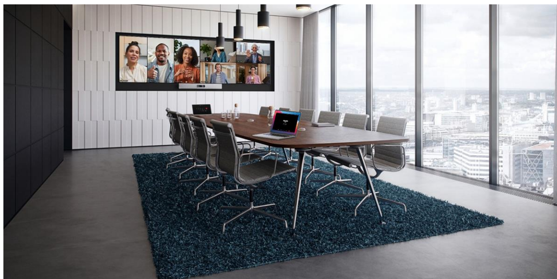
図 1. 会議室での Cisco Room Kit EQ とクアッドカメラ、テーブルスタンドの Room Navigator、および Cisco Table Microphone Pro

Room Kit EQ は、高度にモジュール化された設定によりオプション性と拡張性を提供し、タッチコントローラ、カメラ、スピーカー、マイク、およびその他のルーム周辺機器を簡単に追加し、複雑なマルチコンポーネントのオーディオビジュアル環境の構成とスケリングを容易にします。このソリューションは、機能とエクスペリエンスが豊富でありながら、ワークスペースへの展開、維持、およびスケリングが容易であり、統合されたクラウドデバイス管理と Control Hub のワークスペース分析が付属しています。