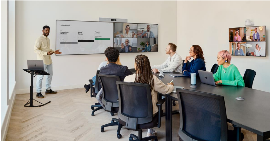
図 3. Quad Camera、PTZ 4K カメラ、Room Navigator 机上タッチコントローラ、Cisco Table Microphone Pro デバイスを備えた大規模なトレーニングルームでの Cisco Room Kit EQ