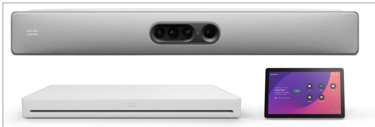
図 2. Cisco Room EQ バンドルの主なコンポーネント：Cisco Codec EQ、Cisco Quad Camera、Cisco Room Navigator タッチコントローラ。