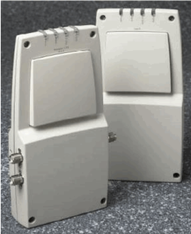
A. External-Antenna Model B. Internal-Antenna Model

Remarque: Les LAP de la gamme 1000 doivent utiliser les antennes internes ou externes d'usine fournies afin d'éviter une violation des exigences FCC et une annulation du droit d'usage de l'équipement par l'utilisateur.