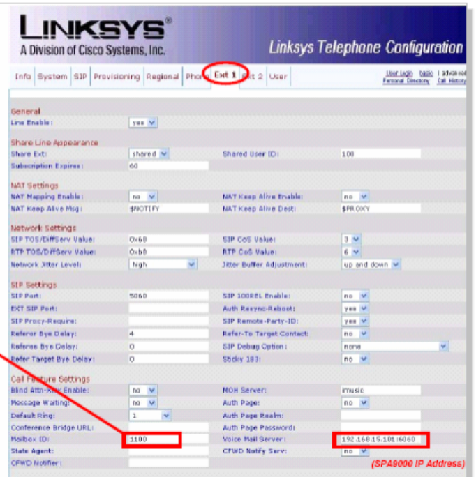
Figure 6: SPA IP Phone Configuration Utility, Ext 1 Page