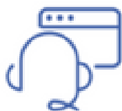
WebRTC Agent Desktop