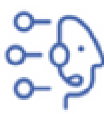
Virtual Agent Google DialogFlow CX