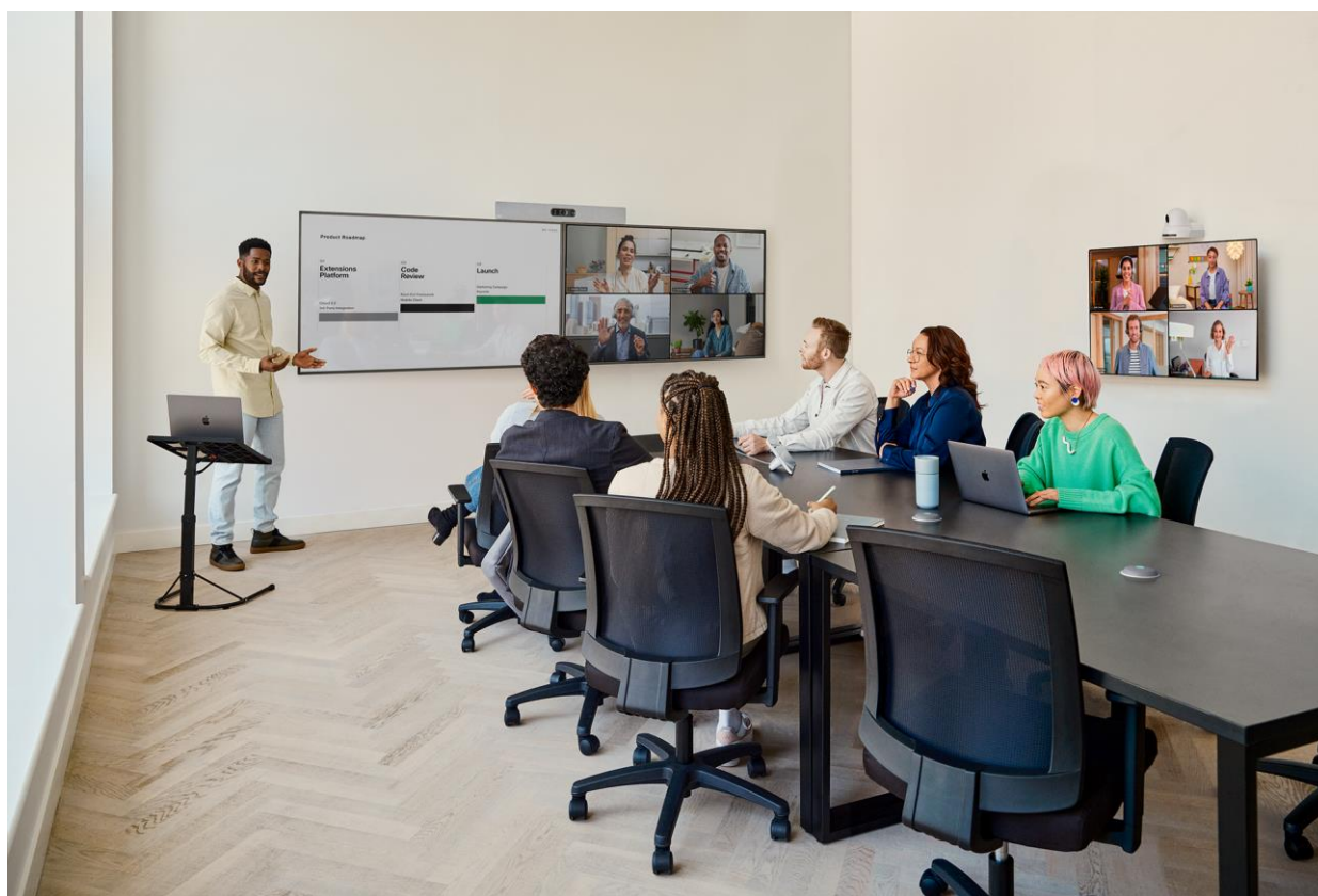
Figura 2. El Cisco Table Microphone Pro utiliza con el paquete extendido Cisco Room Kit EQ para proporcionar captura de voz multidireccional desde una sala de reuniones grande.