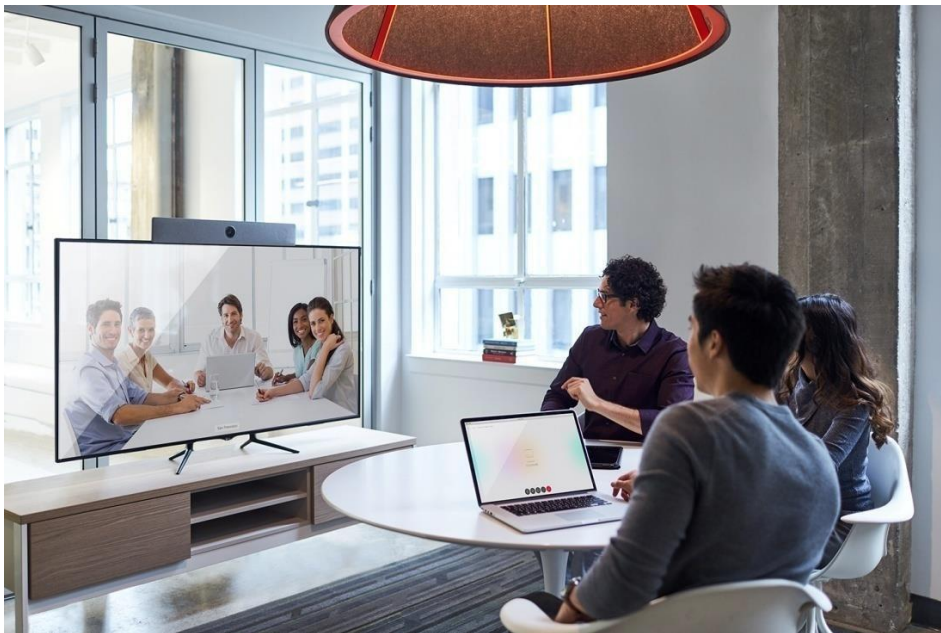
图 1. 小型会议室场景中的思科 Spark Room Kit

Room Kit将摄像机、编解码器、扬声器和麦克风集成到单个设备中，非常适合中小型会议室使用。它采用先进的摄像机技术，使小型会议室环境也能实现发言者跟踪（跟踪距离可至6米）。在保证丰富的功能和体验的同时，该产品在定价和设计上也经过仔细考量，可确保轻松扩展到您的所有中小型会议室和空间，无论您是选择本地注册还是通过思科®协作云注册到思科 Spark，都能获得这些优势。