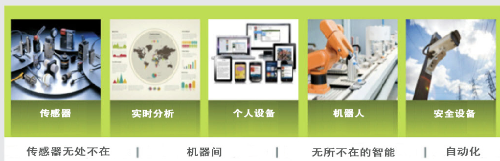
图 2. 万物互联

车间，以及补给制造过程的供应链连接到一起。据 Aberdeen Group 的研究结果，70% 的制造业管理人员正在关注工厂车间的数据举措，目的是推动卓越运营和业务、缩短上市时间，并即时获取来自车间机器的数据。