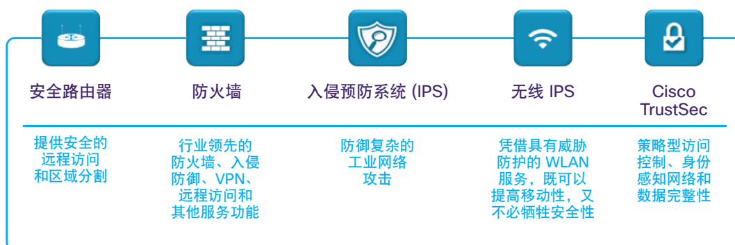
图 4. 思科工业安全产品组合

这类安全保护在工业环境中的作用也越来越凸显。“这个世界充满了以前从未发现的网络威胁，获得其可见性有助于我们的团队重树信心：在我们的工业网络中增加入侵防御技术，这种做法是正确的”，世界领先的工业气体、医疗气体及环境气体生产商 Air Liquide 的国家供应与管道业务主管 Charles Harper 说。图 4 展示了思科互联工厂平台提供的安全功能范围。